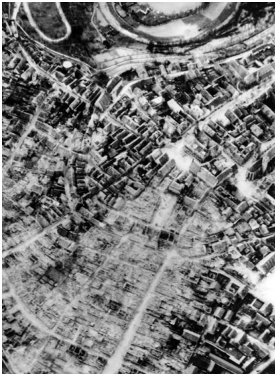
Luftaufnahme des Kriegszerstörten Rothenburgs, 1945

Wir befanden uns in der Nähe der Ardennen und hörten manchmal weit entfernte Gefechte, die Zeitungen berichteten von den harten Kämpfen und konnten die Niederlage nicht verbergen. Wir hatten viele Verwundete.