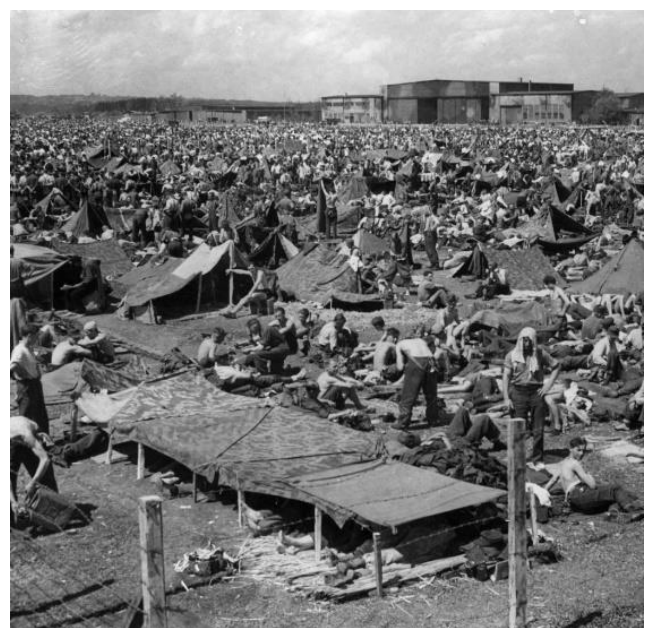
10. Mai 1945: Auf dem Flugfeld von Bad Aibling in der Nähe von München waren mehr als 80000 deutsche Soldaten, welche vor allem in den österreichischen Alpen in Kriegsgefangenschaft gerieten, auf engstem Raum zusammengebracht.

Ich und andere Krankenschwestern wurden verhaftet und in ein Lager weiter im Norden gebracht. Wir hatten Gerüchte gehört, dass die großen Internierungslager entlang des Rheins sehr schlimm seien und wir wollten nicht dorthin gehen. Ich wurde in ein Frauenlager gesteckt, und wir befanden uns in der Nähe eines großen Männerlagers, ich konnte sehen, dass es eine Unterkunft gab, und die Männer sahen kränklich aus. Das war, glaube ich, im Juni 45. Nach den Kriegsregeln hätten wir nach Hause geschickt werden müssen. Andere Frauen erzählten mir, dass andere in ehemalige Konzentrationslager gebracht wurden, wo Typhus die Menschen tötete.