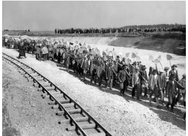
Unterhaching/Taufkirchen: Der Tag der 10000 Spaten am 21. März 1934, der Auftakt zum Bau der Autobahn München-Salzburg

Trude: Ja, ich wurde 1919 geboren und wuchs als Stadtkind auf, ging zur Schule und erhielt meine Ausbildung in der Nähe. Ich erinnere mich an die Wahl Hitlers und daran, dass die meisten Menschen nicht wussten, was sie von ihm halten sollten. Die Straßenkämpfe und das Chaos der Zeit des Kampfes blieben uns erspart, meine Eltern wollten damit nichts zu tun haben. Mein Vater arbeitete als Förster und kam gut über die Runden, meine Mutter war halbtags Bibliothekarin. Die Zeiten waren nicht so schlecht für uns, aber viele Deutsche glaubten, dass Hitler das Leben für sie besser machen würde.