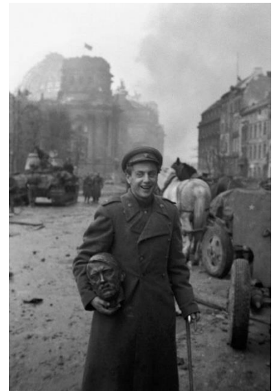
Nachdem er eine Büste seines Erzfeindes geplündert hat, schlendert dieser sowjetische Jude grinsend durch die Ruinen Europas und ist zweifellos froh über den Tod und das Leid, das sein Volk verursacht hat.

Sie gaben mir sogar die Medizin, die ich zur Behandlung der Infektion brauchte. Das hielt jedoch nicht lange an, denn dann kamen die politischen Soldaten und brachten alle Deutschen in Sammellager. Als sie uns durch die Straßen marschieren ließen, war ich fassungslos über die Zerstörung, die die Schlacht angerichtet hatte. Sie hielten mich bis August fest und entließen dann alle älteren Männer, die im VS gekämpft hatten. Sie wussten nicht, dass ich zuvor im Heer gedient hatte.