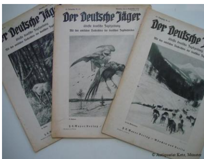
Der Deutsche Jäger. Älteste Deutsche Jagdzeitung. Mit den amtlichen Nachrichten der deutschen Jagdbehörden

Mir wurde immer gesagt, dass in Deutschland der Waffenbesitz nicht erlaubt war. In den USA wird immer behauptet, Hitler habe den Menschen die Waffen weggenommen.