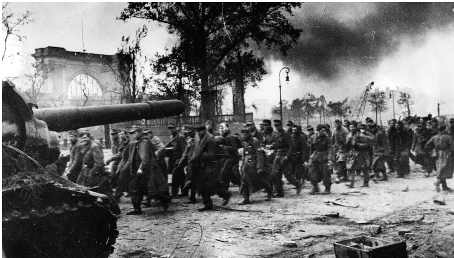
Deutsche Soldaten marschieren in die Gefangenschaft. Im Hintergrund steht die Ruine des Lehrter Bahnhofs (heute Hauptbahnhof).

3. Panzer-Division (Wehrmacht) Volkssturm