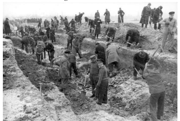
Der Volkssturm beim Ausheben von Panzergräben vor Berlin, Februar/März 1945

Ende März 1945 waren wir mit der Ausbildung fertig und einsatzbereit. Wir marschierten nach Rüdersdorf, um der sowjetischen Offensive auf Berlin entgegenzutreten. Mein Zug stellte sich neben der Straße an einem Teich auf und grub Schützengräben aus. Wir hörten Artilleriefire und die sowjetischen Flugzeuge griffen regelmäßig an und