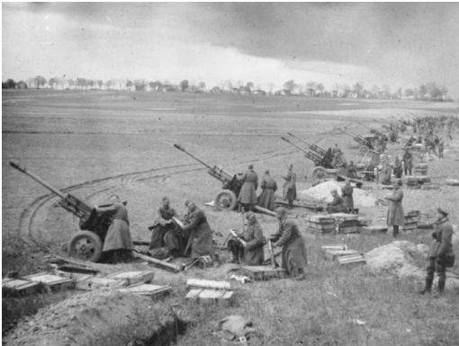
Ein Blick auf die gegen Berlin aufgestellte Artillerie

beschossen Zivilisten auf ihrem Weg zurück nach Berlin und in den Westen. Ich habe das ein paar Mal gesehen, ohne dass es eine militärische Präsenz gab, die diese Angriffe rechtfertigen konnte. Weitere Armeeeinheiten stießen von Süden her zu uns und bewegten sich vor uns.