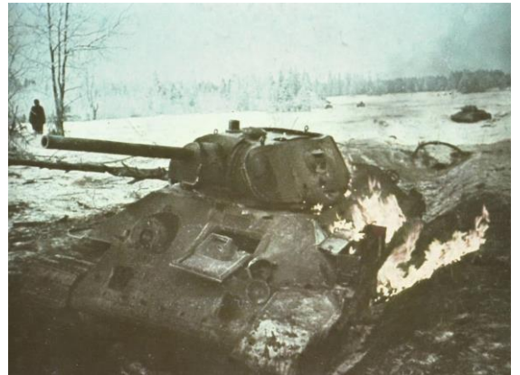
Abgeschossene russische T-34 an der Ostfront

Weitere Artillerie und Mörser trafen uns und verursachten einige Verluste und sie kamen wieder mit Panzern. Wieder schaltete die Pak den Führungspanzer aus und die Infanterie wurde zurückgeschlagen. Bis jetzt sah es für uns leicht aus. Weitere Panzer kamen und drängten die anderen von der Straße. Diesmal wussten sie, wo die Pak war und ein Volltreffer tötete die Besatzung. Wir sprangen auf; ich nahm eine Panzerfaust und zielte auf einen T34, der jetzt in der Nähe war. Ich zielte auf den Turmdrehkranz und feuerte. Der Panzer explodierte und kam zum Stillstand. Kaum hatte ich gelächelt, regnete es Granaten von anderen Panzern hinter ihm, die uns zu Boden zwangen und in alle Richtungen verstreuten.