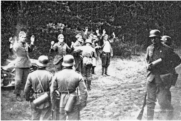
1. September 1939. Die ersten polnischen Gefangenen auf einem Pfad im Wald zwischen Pruszcz und Zepolna.

stand, dass die neue polnische Hauptstadt Berlin sein würde. Am 1. September 1939 war meine Einheit eine der ersten, die die Grenze überquerte. Wir trafen auf polnische Wachen, die schnell entwaffnet und nach hinten geschickt wurden.