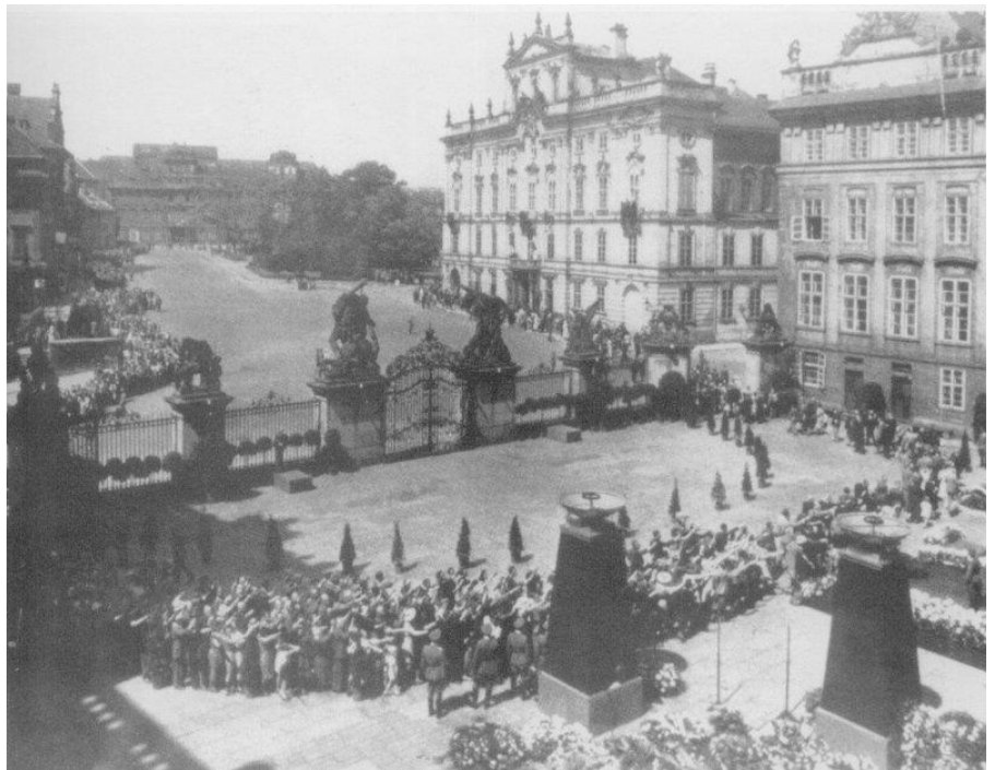
Ein weiteres sehr seltenes Foto von den Abschied nehmenden Tschechen. Hier sind die langen Schlangen von Menschen sehr gut zu sehen.

Lina: Wenn ich Ihre Frage richtig verstehe, hat mein Mann wie Himmler in Bezug auf die Religion gedacht? Ich werde sagen, dass mein Mann ein Christ und ein SS-Mann war und ich werde versuchen, das zu erklären. Die SS war eine Einheit, die auf der Liebe zum Volk, der Verehrung der Vergangenheit und der Ehrung unserer Herkunft beruhte. Ein Thema, mit dem sich der Reichsführer-SS Himmler stundenlang beschäftigte, war die Frage, woher wir kamen. Wie kommt es, dass fast die ganze Welt