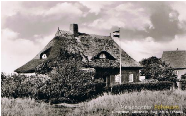
Heydrichs Strandhaus auf Fehmarn

Lina: Ja, die SS kümmert sich immer um die ihren, so gut wir können. Mein Mann hatte sehr loyale Freunde und Kameraden. Er war wegen seiner Freundlichkeit und seiner direkten Art sehr beliebt. Ich