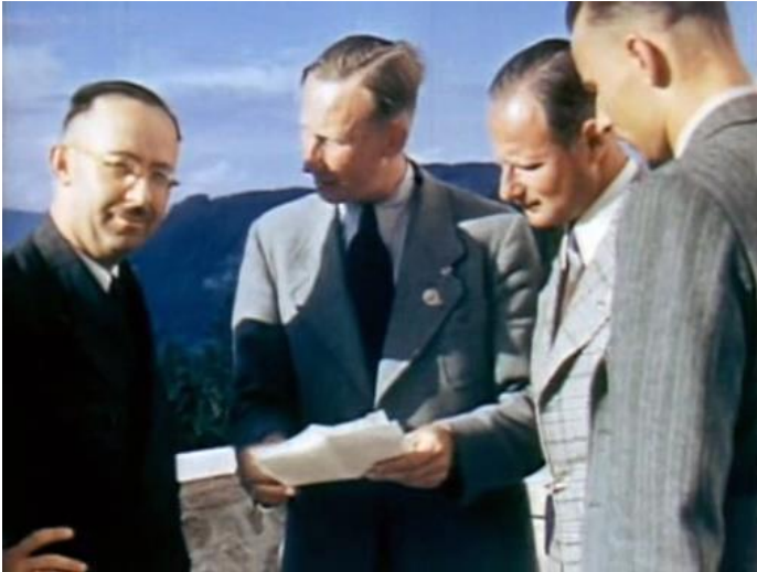
Heinrich Himmler, Reinhard Heydrich und Karl Wolff auf dem Berghof. Stummer Farbfilm, aufgenommen von Eva Braun, Mai 1939.

Hatte Ihr Mann jemals eine andere Meinung als Himmler?