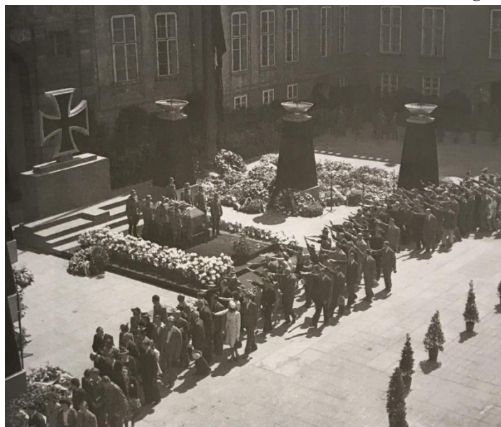
7. Juni 1942 im Hof der Prager Burg. Der ausgestellte Sarg mit den sterblichen Überresten von Reinhard Heydrich.

Er machte sich an die Arbeit, um das zu ändern, indem er bessere Rationen, Arbeitsbedingungen, bezahlten Urlaub und Reisen, weniger Kontrolle und einen besseren Zugang zu ihm anordnete. Er wollte, dass die Menschen Deutschland zum Sieg verhalfen und versicherte ihnen, dass ihre Stimme