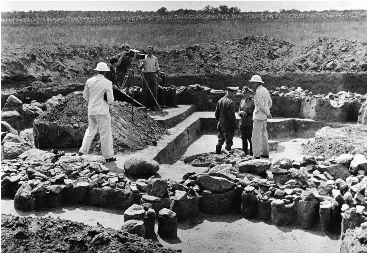
Ausgrabungen in Solonje in der Ukraine, 1943

von nur einer Rasse erobert und beeinflusst wird? Was macht diese Rasse so besonders? Das war es, was das Ahnenerbe erforschen sollte, und warum die SS es unterstützte.