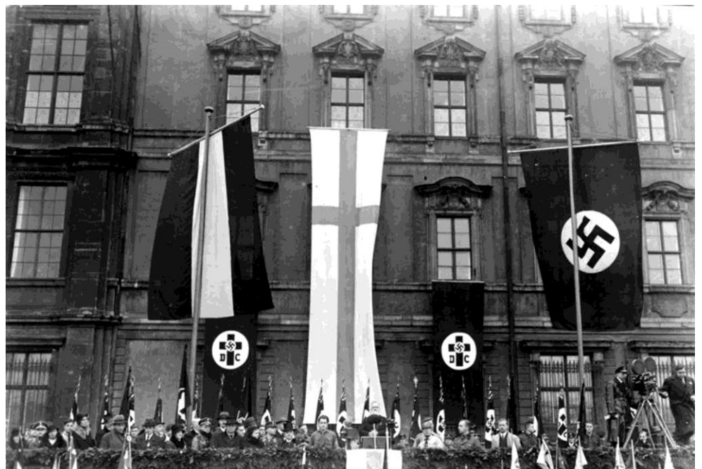
Die große Feier des Luthertages im Lustgarten in Berlin am 19. November 1933, Bischof Hossenfelder hält die Ansprache auf der Rampe des Berliner Schlosses.

Wilhelm Brachmann [wikipedia] Deutsche Christen