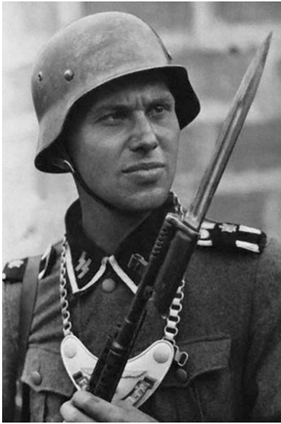
Ein Freiwilliger der Nordland

Führers SS-Männer aus ausländischen Freiwilligeneinheiten waren. Männer aus Frankreich, Dänemark, Schweden und Norwegen verteidigten den Bunker bis zur letzten Stunde. Sie taten dies in der Überzeugung, dass der Bolschewismus um jeden Preis besiegt werden muss, um die Welt vor der