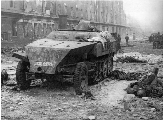
Ausgebranntes gepanzertes Fahrzeug der "Nordland" in Berlin, Mai 1945. Darin und drum herum liegen die zerbrochenen Körper einiger der tapfersten Verteidiger Europas.

Diese Orden sind meine Erinnerung an meine Kameraden, an unsere Sache und an die brüderliche Verbundenheit, die wir alle damals hatten. Die Dinge waren ganz klar: Entweder man kämpft wie ein Krieger oder man stirbt wie ein Sklave. Wir entschieden uns für den Kampf, und die Männer hatten die Chance, nach Hause zurückzukehren, aber nur wenige taten es. Wir haben unseren letzten Tropfen Blut in Berlin vergossen, um eine Idee zu verteidigen, die gestorben ist. Ich galt als hochdekoriertes Soldat, die Medaillen zeugten von meinem Mut und meiner Tapferkeit, heute sind sie nichts weiter als ein stummes Zeugnis der Hölle, durch die wir gegangen sind. Ich bin dankbar, dass ich meiner Nation ehrenvoll gedient habe, aber ich werde immer an die denken, die nicht nach Hause zu ihren Müttern oder Frauen kommen konnten.