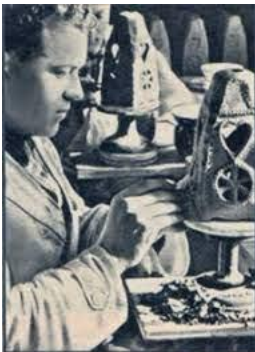
Der Jul-Leuchter der Porzellan-Manufaktur Allach

Anlässen meldete. Sie durften die Uniform nur während des Dienstes tragen und nur eine Anstecknadel, die die Mitgliedschaft zeigte.