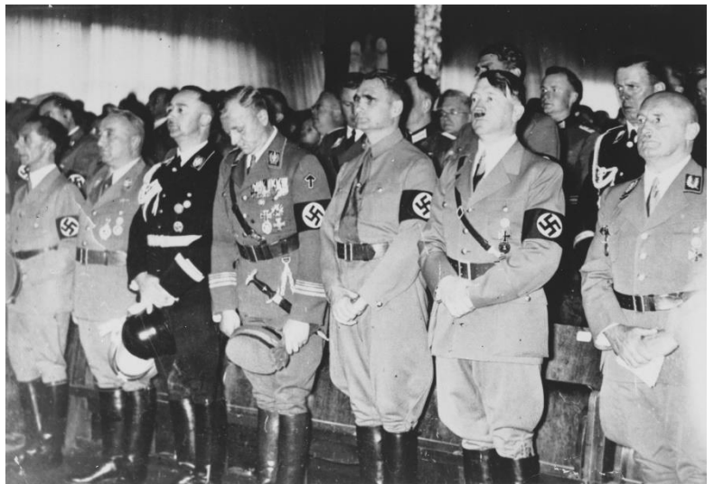
NS-Funktionäre bei den Eröffnungsfeierlichkeiten des Parteitags 1938 in Nürnberg von links nach rechts sind Joseph Goebbels, Robert Ley, Heinrich Himmler, Victor Lutze, Rudolf Hess, Adolf Hitler und Julius Streicher