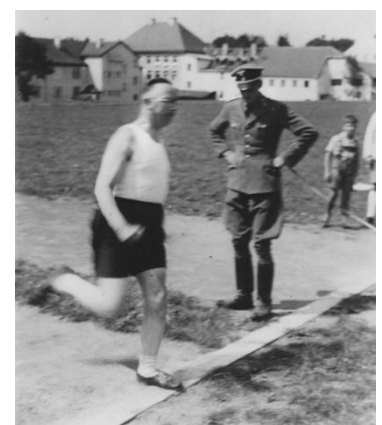
Auch der Reichsführer-SS war sportlich...

Sie liebte es, denn sie sah aus wie eine hochrangige Person und wurde von denen, die sich fragten, wer diese Frau war, begrüßt. Er kannte auch viele seiner SS-Offiziere mit Namen und schickte bei wichtigen Terminen immer einen persönlichen Gruß. Ich tippte sie, stempelte sie und schickte sie ab, sobald er sie genehmigt hatte. Er ließ uns immer irgendeine Art von Übung draußen machen, wie Dehnen, Rennen oder Ballwerfen. Sport war zu dieser Zeit sehr wichtig.