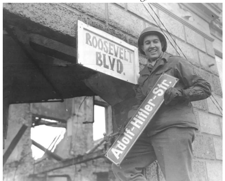
Der Hochmut der „Befreier“

Sie fragten mich, ob ich von den Lagern wüsste, natürlich wusste ich es. Sie wollten von mir hören, dass ich wusste, dass Menschen in