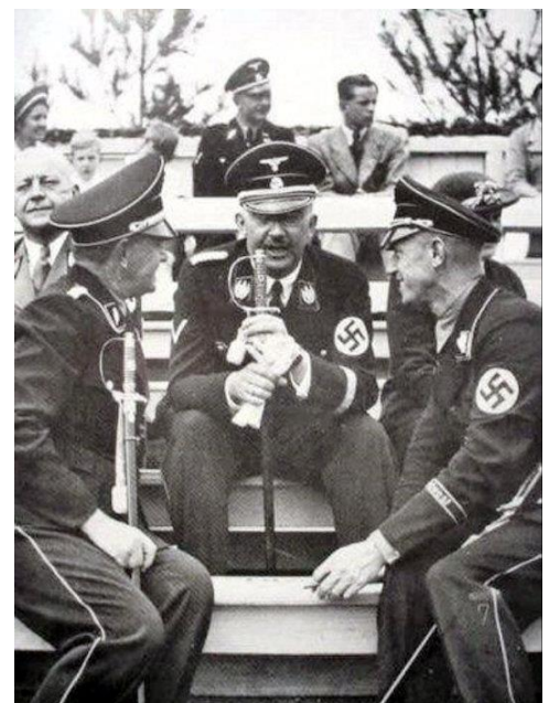
Der Reichsführer-SS mit seinem Ehrendeggen

Hedwig Potthast (Wiki) Heinrich Luitpold Himmler