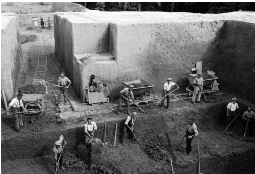
Die Grabungsmannschaft der Hohmichele-Ausgrabung für das Ahnenerbe, 1937

Er war kein Fan der Kirche und das meine ich so, wie Sie es vielleicht verstehen. Er war wie Hitler der Meinung, dass die Kirchen in Deutschland wie die Knochen eines alten Mannes geworden waren, zerbrochen und missgestaltet. Man hat sie, um unsere Rasse und das Fundament unserer Nationen zu zerstören.