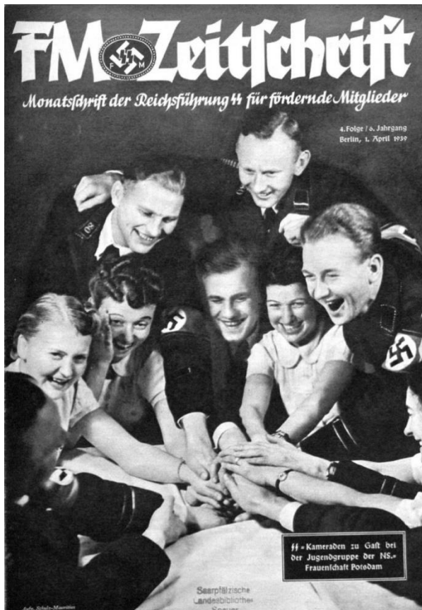
Kameradschaft und Gemeinschaft

seiner Arbeit besessen war und die Dinge immer auf die richtige Weise organisieren wollte. Als wir uns an den jeweils anderen gewöhnt hatten, fragte er mich oft nach meiner Meinung.